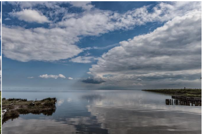
Ed infine una spettacolare immagine dello stesso autore scattata dal monte Pizzoc verso la laguna di Venezia.